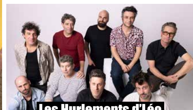
Les Hurlements d'Leo

ENTRACTE SERVI PAR L'AMICALE LAÏQUE - CRÊPES/CIDRE